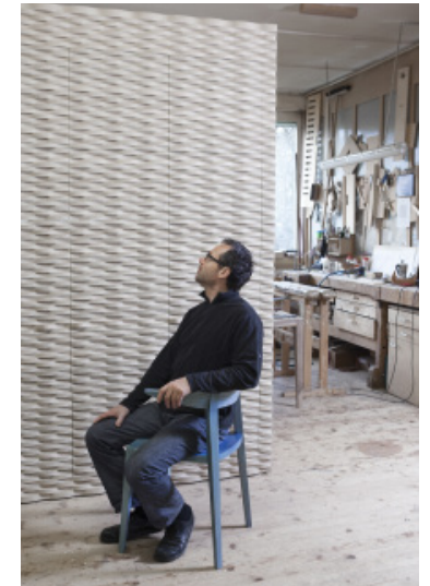
Stuhl toro und Eichen-Schrank ondulato mit integrierter Griffleiste. Links, Strickwand mit Schutzschicht-Rest. / Chaise toro et armoire en chêne ondulato avec prises intégrées. À gauche, paroi poutre sur poutre avec reste de couche protectrice.

Text Eva Holz / Form Forum Schweiz